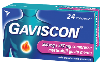
GAVISCON 500 mg + 267 mg 24 compresse gusto menta