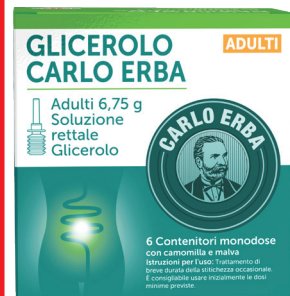
GLICEROLO CARLO ERBA ADULTI 6,75 g

Soluzione rettale 6 contenitori monodose con camomilla e malva