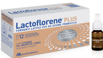
LACTOFLORENE PLUS 12 flaconcini

CONTINUA LA PROMOZIONE DI MARZO VALIDA FINO AL 30 APRILE 2026