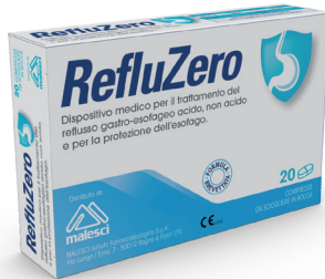
REFLUZERO 20 compresse