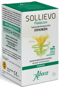
SOLLIEVO FISIOLAX 90 compresse