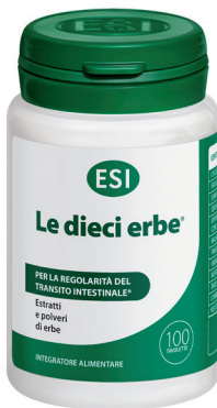
LE DIECE ERBE 100 tavolette