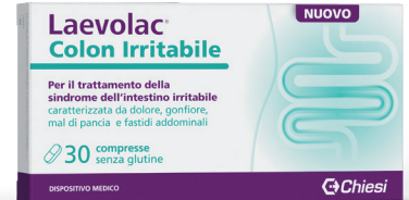
LAEVLAC COLON IRRITABILE 30 compresse