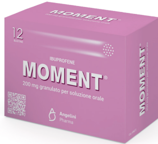
MOMENT 200 mg 12 bustine granulato