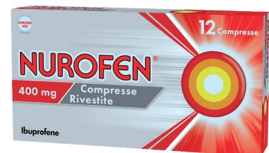
NUROFEN 400 mg 12 compresse rivestite • NUROFENCAPS 400 mg 10 capsule molli