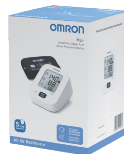
OMRON M2+ MISURATORE DI PRESSIONE