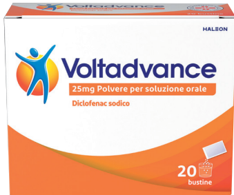
VOLTADVANCE 25 mg 20 bustine