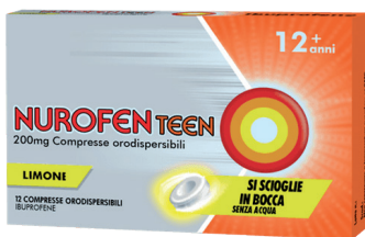
NUROFENTEEN 200 mg 12 compresse orodispersibili gusto limone