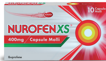
NUROFENXS 400 mg 10 capsule molli