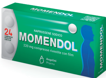
MOMENDOL 220 mg 24 compresse rivestite