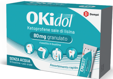
OKIDOL 80 mg 10 bustine senza acqua

È un medicinale senza obbligo di prescrizione (SOP) che può essere consegnato solo dal farmacista. Ascolta il tuo Farmacista.