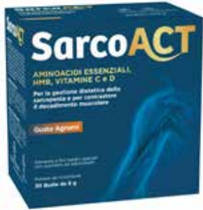
SARCOACT 30 buste da 8 g gusto agrumi