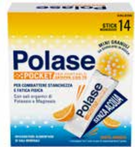
POLASE POCKET 14 stick monodose gusto arancia