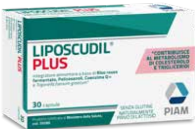
LIPOSCUDIL PLUS 30 capsule