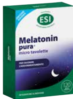
ESI MELATONIN PURA 120 micro tavolette