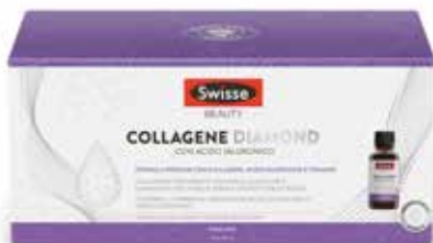
SWISSE COLLAGENE DIAMOND 10 flaconcini da 30 ml

CONTINUA LA PROMOZIONE DI MAGGIO VALIDA FINO AL 30 GIUGNO 2026