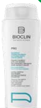
BIOCLIN PRO SHAMPOO DERMATOLOGICO ultradelicato addolcente 400 ml