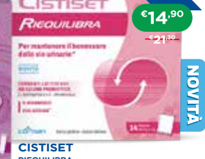
CISTISSET RIEQUILIBRA 14 bustine da 2 g + 2 g