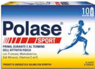
POLASE SPORT 10 bustine gusto arancia