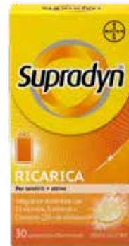
SUPRADYN RICARICA 30 compresse effervescenti