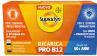
SUPRADYN RICARICA PRO B12 10 flaconcini