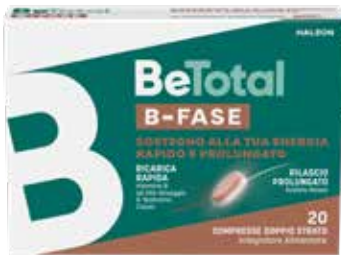
BETOTAL B-FASE 20 compresse doppio strato