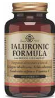
IALURONIC FORMULA 30 tavolette