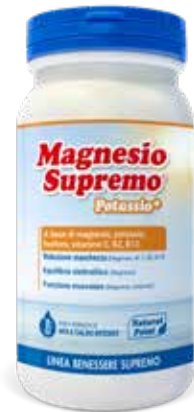
MAGNESIO SUPREMO POTASSIO+ • 150 g • 24 bustine