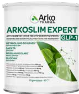
ARKOSLIM EXPERT GLP-1 270 g