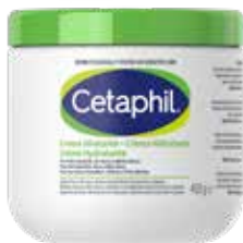
CETAPHIL CREMA IDRATANTE 450 g