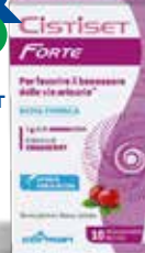
CISTISSET FORTE 10 Stick orolubili da 2,5 g